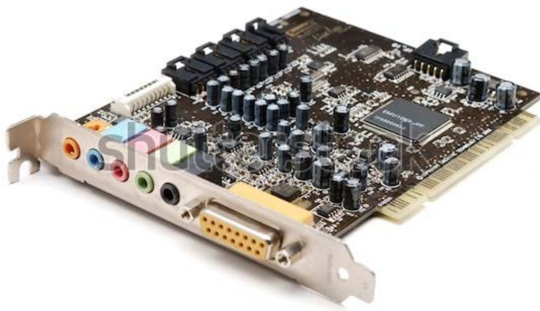
Рис.2.29 Внутренняя звуковая карта

Аудио технологии развиваются и проникают во все сферы деятельности человека. Сегодня производители оснащают технику голосовыми ассистентами и это не только в смартфонах, а даже в умных холодильниках, которые скажут о нехватки каких – либо продуктов. Много устройств появляются на рынке со встроенным помощником Google Assistant, Microsoft Cortana, Алиса Яндекс и т.д., например, умный дом, умная розетка, кофеварка, телевизор, планшет. Развивается отрасль речевой биометрии, идентификация по голосу. Такую технологию распознавания речи стараются развивать в больших компаниях, как сбербанк. Распознавание речи может быть в виде отдельного устройства, например устройство «Чарли», разработанное российской компанией Лаборатория «Сенсор-Тех». Оно может переводит устную речь в текст с выводом на экран смартфона, планшета, телевизора или Брайлевского дисплея. Конструктивно состоит из четырех микрофонов, способных захватывать человеческую речь в радиусе 360 градусов. Это устройство было разработано для людей с ограниченными возможностями.