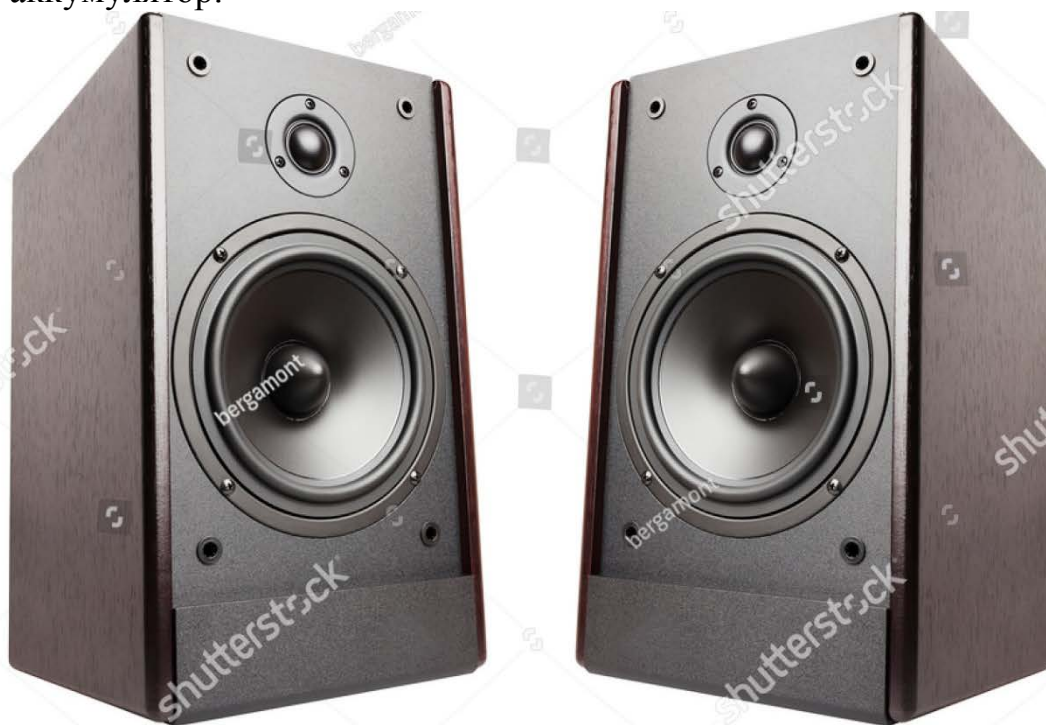
Рис.2.34 Акустическая система (2 колонки)

оформления; по сопротивлению; по типу крепления (без крепления, затылочная душка, крепление на ухе, на козырек, оголовье и с заушниками); по типу конструкции (охватывающие (мониторинга музыки и для игр), накладные, вакуумные, наушники-вкладыши, наушники-клипсы). Пример, проводные наушники HyperX Cloud Orbit HX-HSCO-GM черный, 7.1, охватывающие, 10 - 50000 Гц, проводной, кабель - 1.5 м. Эти наушники способны реализовать многоканальный режим работы – 7.1, а также указан диапазон частот, который говорит о качестве звука. Человеческое ухо воспринимает диапазон частот в пределах 20-20 000 Гц. Также наушники характеризуются чувствительностью, сопротивлением, максимальной (паспортной) входной мощностью – это громкость звучания; уровень искажения, чем меньше, тем лучше. В продаже есть специальные усилители для наушников, FiiO Q1 II Black стерео, мощность 0.112 Вт (на канал), два выхода на наушники, встроенный ЦАП, коэффициент гармоник 0.002 %, встроенный аккумулятор.