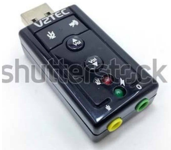
Рис.2.30 Внешняя звуковая карта интерфейс USB

по соответствующим шинам; ЦАП цифро-аналоговый преобразователь, обеспечивает вывод аналогового звукового сигнала в колонки или наушники и соответствующий ему фильтр.