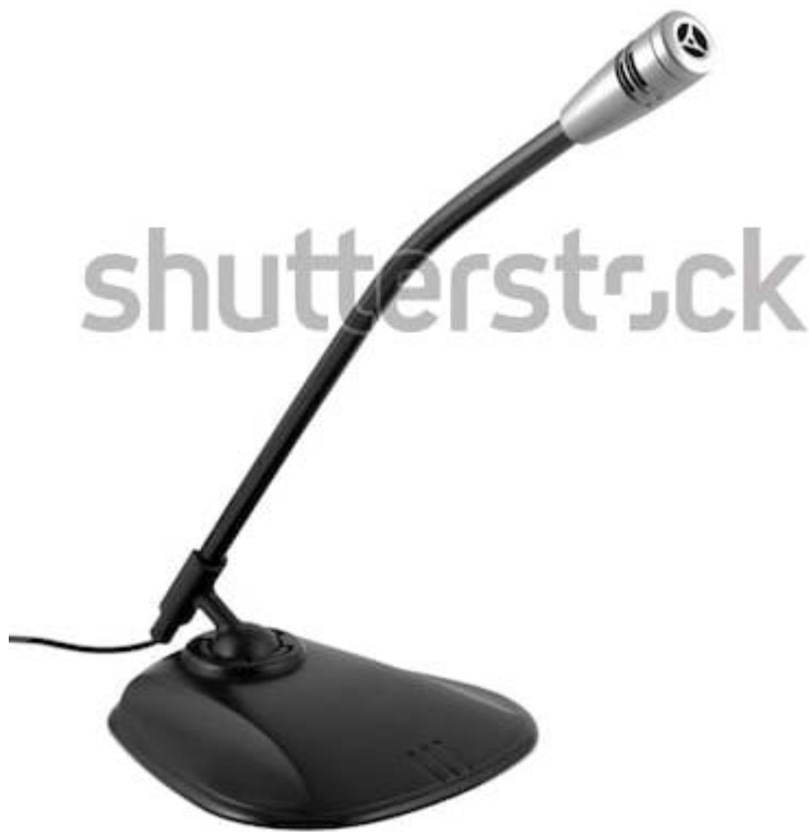
Рис.2.32 Настольный микрофон