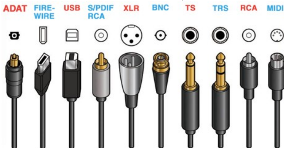
Рис.2.31 Порты звуковой карты

Интегрированные звуковые карты в системную плату используют ресурсы центрального процессора, по качеству звука почти не уступает дискретной. На современных материнских платах фирмы Gigabyte применяют высококачественные High-End аудиоконденсаторы японской компании Nichicon™, что позволяет воспроизвести на этих платах идеальный звук.